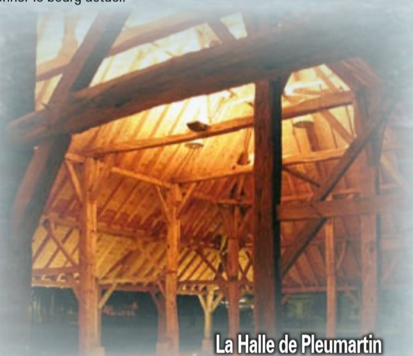
La Halle de Pleumartin

Dès le XII e siècle, un prieuré et une cure s'installent à Saint-Sennery. Plus tard, à 3 km, un village s'établira près du château de Pleumartin pour donner le bourg actuel.