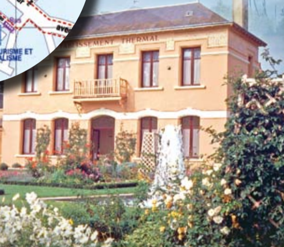
Le Pavillon Rose et ses jardins La Roche Posay