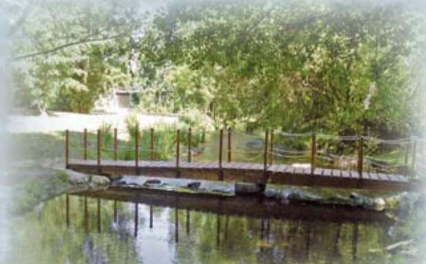
Ponton à Vicq sur Gartempe

Au cours de votre balade, faites une halte à Vicq-sur-Gartempe , qui se situe en aval du confluent de deux rivières poissonneuses : la Gartempe et l'Anglin.