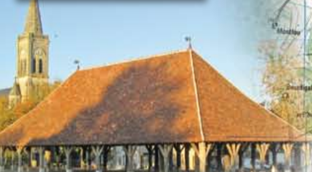
La Halle de Pleumartin