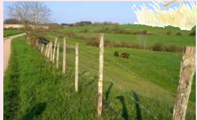
Le val de la Font de l'Étang Pipit rousseline

Poursuivez le chemin jusqu'à la route. Prenez à gauche, puis aussitôt à droite. Avancez lentement en guettant les plus hautes branches des buissons qui bordent le chemin. Vous y trouverez probablement le bruant jaune et le bruant zizi, ainsi que la pie-grièche écorcheur. Lorsque vous avancerez, ceux-ci quitteront leur perchoir pour disparaître sur la droite. Arrêtez-vous sous le